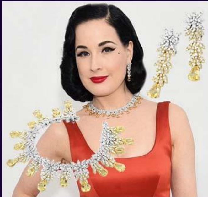
Дита фон Тиз в стильном берилловом ожерелье Pasquale Bruni