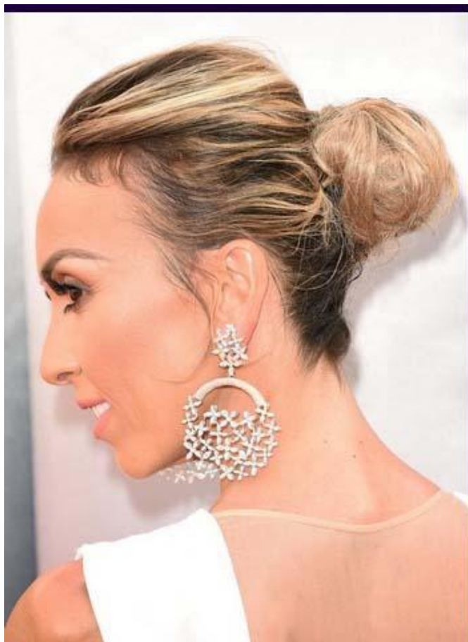
Американская журналистка, актриса и телеведущая Джулиана Ранчич в серьгах Forevermark,