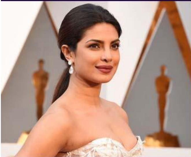
Индийская актриса и модель При- янка Чопра в серьгах от Lorraine Schwartz и кольцо с 2,30-каратным круглым бриллиантом.