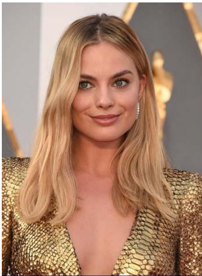
Австралийская актриса Марго Робби на красной дорожке Оскара в бриллиантовых серьгах Forevermark,