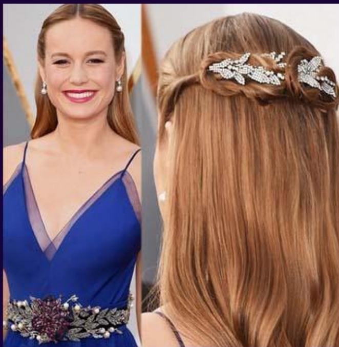
Бри Ларсон в элегантных бриллиантовых и жемчужных серьгах японского бренда Niwaka. Драгоценная заколка для волос и драгоценный пояс от Niwaka оттеняют ее синее платье простого покроя.