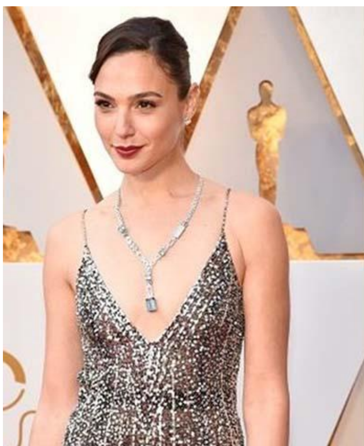
Гал Гадот в колье в стиле Арт Деко от Tiffany & Co. из коллекции Blue Book с аквамаринами (примерно 61 карат) и бриллиантами.