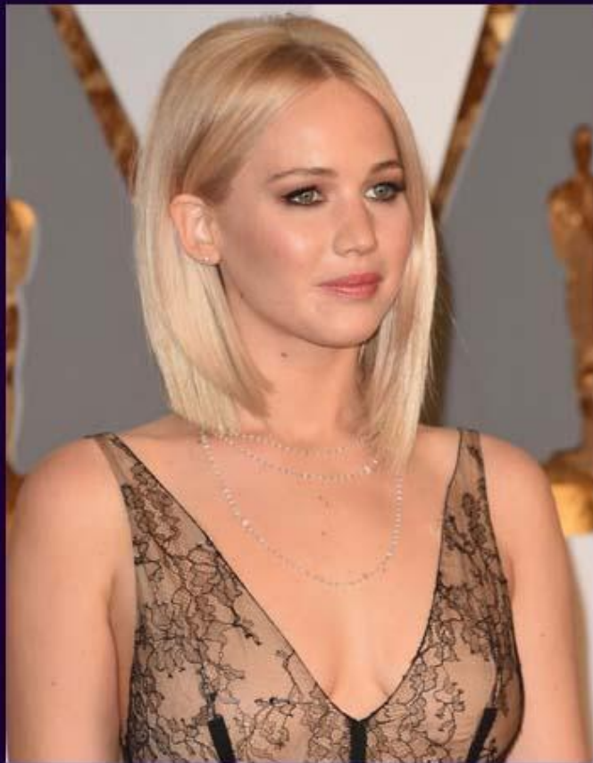
Дженнифер Лоуренс в ожерелье Chopard