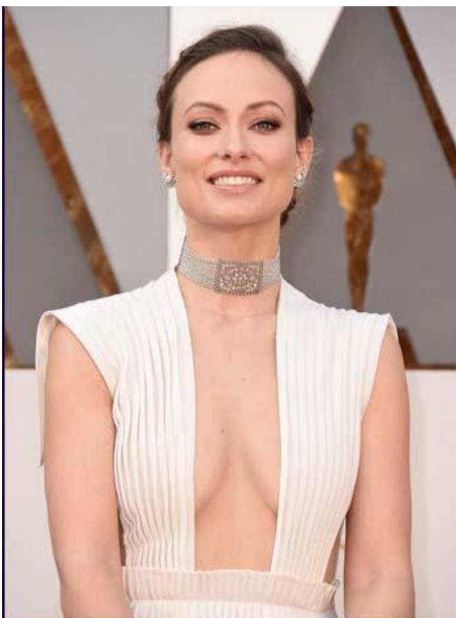
Оливия Уайлд была очаровательна, соединив жемчужный и бриллианто- вый чокер в эдвардианском стиле от Neil Lane со смелым плиссированным платьем с оголенной спиной от Ва- лентино.