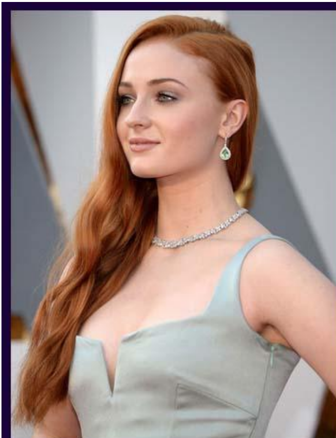
Английская актриса Софи Тёрнер в ювелирных изделиях Tiffany and Co.