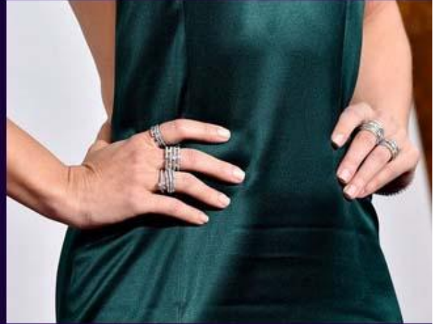
Канадская актриса Рэйчел Макадамс в кольцах и серьгах Chopard.