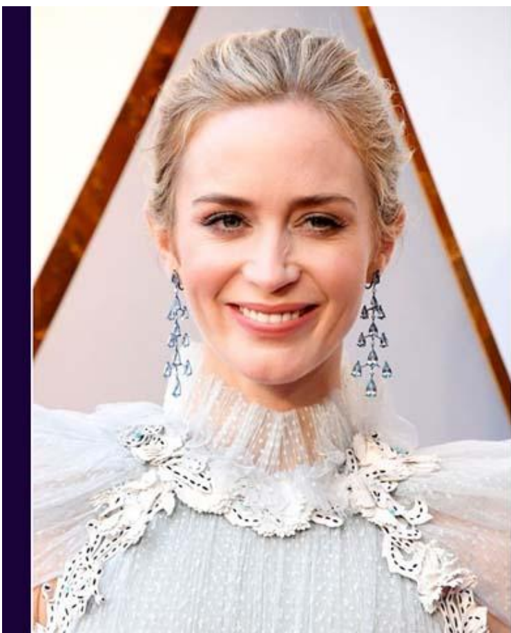
Серьги-канделябры с грушевид- ными сапфирами от Shopard на Эмили Блант.