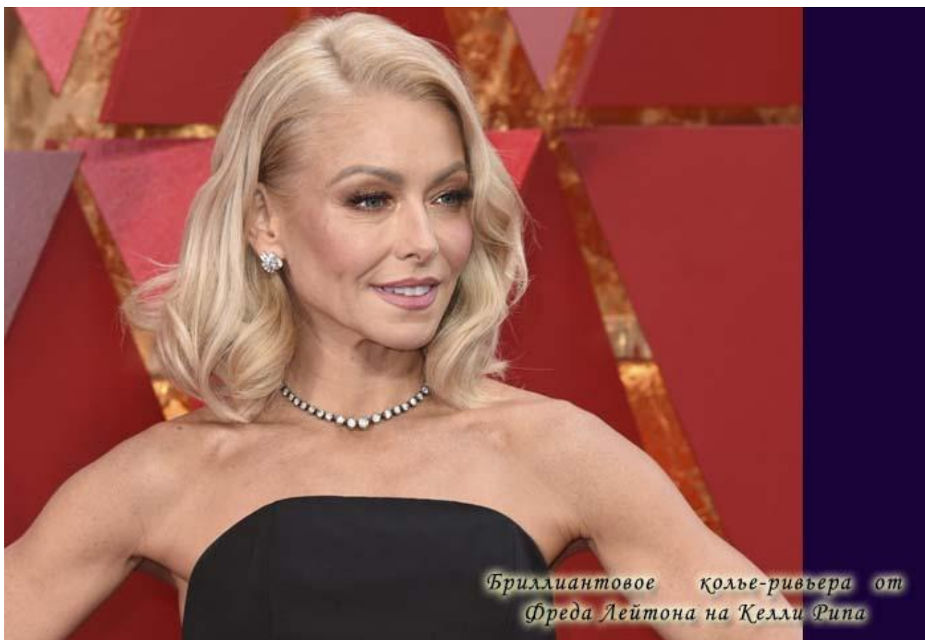
Бриллиантовое колье-ривьера от Фреда Лейтона на Келли Рипа