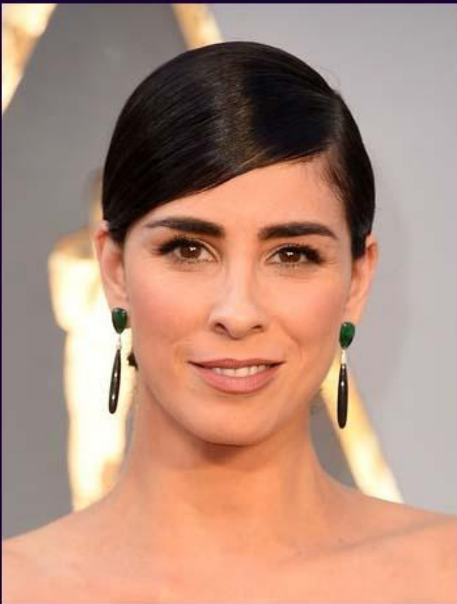
А Сара Сильверман, американская актриса кино и телевидения; сатирик, автор многочисленных скетчей. в ювелирных изделиях Dana Rebecca Designs.