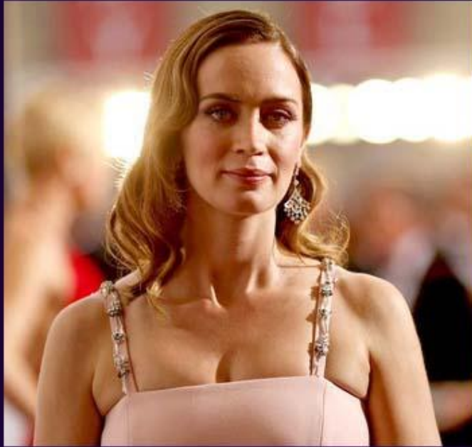
Британская актриса Эмили Блант в серьгах Niwaka.