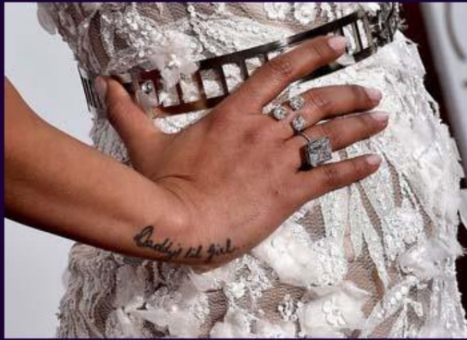
Прианка Чопра с кольцом Lorraine Schwartz.