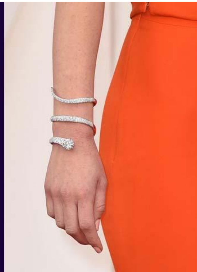
Оливия Манн прибывает на Оскар в уникальном браслете Forevermark за $ 1 млн. Браслет выполнен в виде змейки, нижний камень круглой огранки в 12,06-карат.